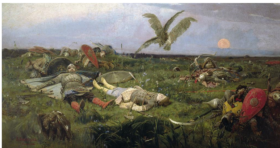
Figure 1. Viktor Vasnetsov . After the battle of Igor Svyatoslavich with the Polovttsy (Illustration of a scene of “The Song of Igor’s Campaign”, 1880, Tretyakov Gallery, Moscow)

Rainer Maria Rilke (1875–1926) translated “The Slovo o Polku Igoryeva” (“The Song of Igor’s Campaign”), a 12 th century Russian epic poem, which is rich in metaphors and motifs of Slavic Paganism, as part of his spiritual and aesthetic quest. “The Song of Igor” covers events in Southern Russia and present Eastern Ukraine in the years 1185–1187. The epic was probably composed shortly after that.