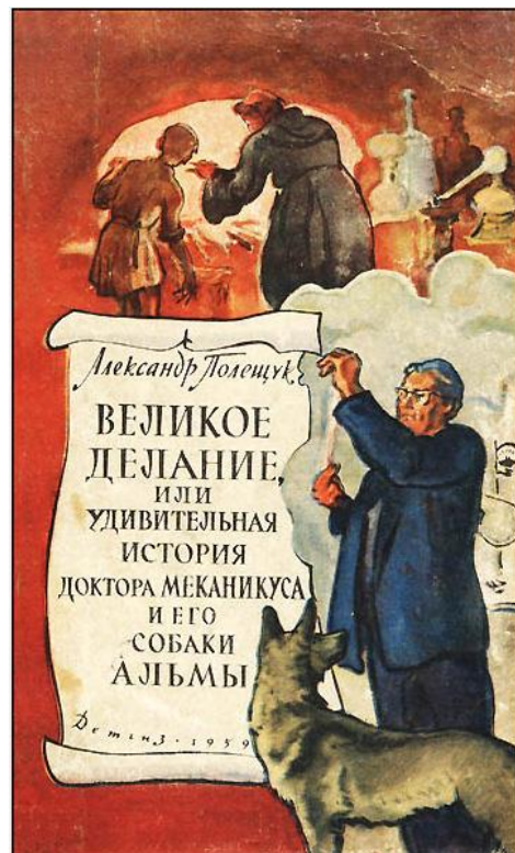
Илл. 4. Издание книги А. Л. Полещука

А. Л. Полещук был весьма примечательной фигурой на фоне авторов фантастики того времени. Его книги были очень популярны среди подростков шестидесятых, да и взрослые читали фантастику Полещука с интересом. О нем восторженно отзывался один из известнейших фантастов СССР – Аркадий Натанович Стругацкий (1925–1991). В одном из писем к брату Борису он просто восторгается повестью А. Полещука об алхимии: «А ты бы поглядел, что выкручивает Полещук! Вот это настоящий талант. Он написал уже третий роман. Второй – блестящая полусказка “Повесть о Механикусе и Говорящей