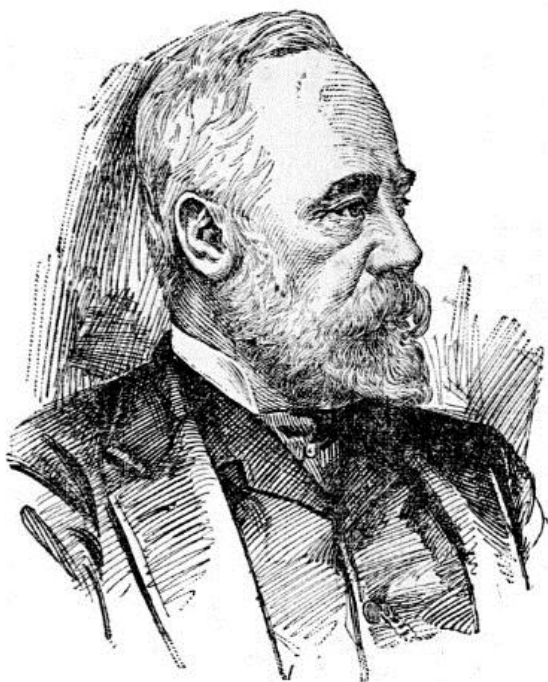
Илл. 1. Стивен Эмменс (1844–1903)

Эмменс изобрел взрывчатое вещество на основе пикриновой кислоты, которое назвал своим именем – эмменсит, и его даже приняли на вооружение в США. Биография Стивена Эмменса и его вполне вписывающиеся в успехи науки конца XIX в. достижения, как мы видим, были весьма далеки от алхимической традиции.